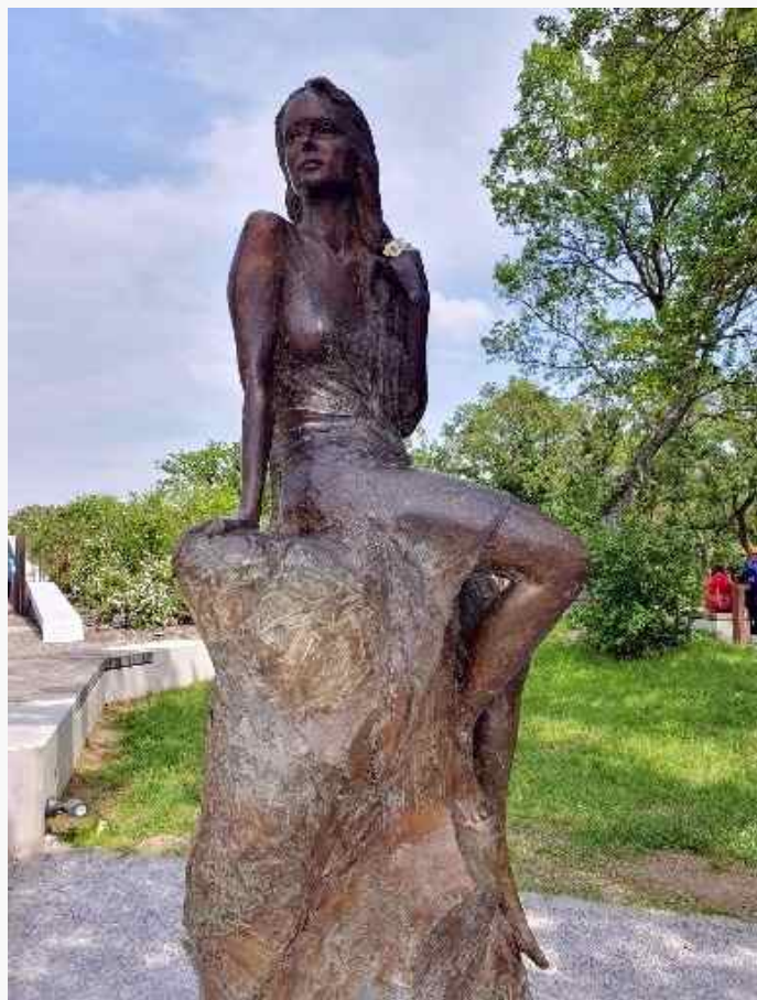
21.05.2023 Auf der Loreley - St. Goarshausen