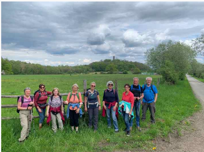
07.05.2023 Alte Weiher Runde - Rheinbach

Treff: Wanderparkplatz am Reisberg, Remagen, 10:00 Uhr