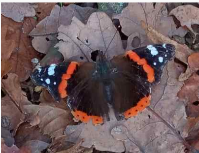
22.11.2023 Admiral Koppe Kreuz

Auch im vorliegenden Wanderprogramm werden so oft wie möglich zur An- und Abreise öffentliche Verkehrsmittel vorgeschlagen. Dies erfordert Pünktlichkeit an den genannten Treffpunkten, damit die Zeit noch reicht zum Lösen der preisgünstigen Gruppenfahrausweise. Viele Wandergebiete sind aber heutzutage an den Wochenenden mit Bahn oder Bus nicht mehr erreichbar, so dass Fahrgemeinschaften mit Privat-PKW sich ausnahmsweise nicht vermeiden lassen. Jeder Fahrer erhält für Hin- und Rückfahrt dann jeweils 25 Cent/km. Die an alle Fahrer insgesamt aus zu zahlende Summe dividiert durch die Zahl aller Mitfahrer ergibt den Fahrtkostenanteil jedes Mitfahrers. Mitfahrmöglichkeiten werden gerne vermittelt, können aber bei unangemeldeter Teilnahme nicht garantiert werden.