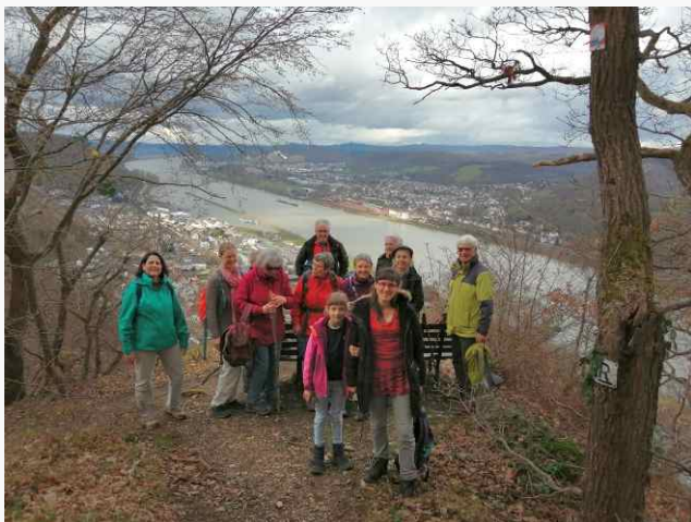
19.03.2023 Blick auf Brohl und Rheinbrohl