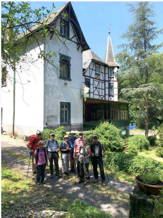
10.06.2023 Mosel - Pommerbachtal