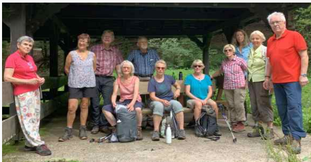
19.08.2023 Am Schönecker Stahlbrunnen

Treff: Parkplatz Bahnhof Remagen, 9:00 Uhr