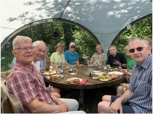
25.06.2023 Im Winzerhäuschen - Mühlenberg