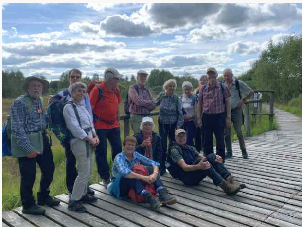
12.06.2023 Im Hohen Venn