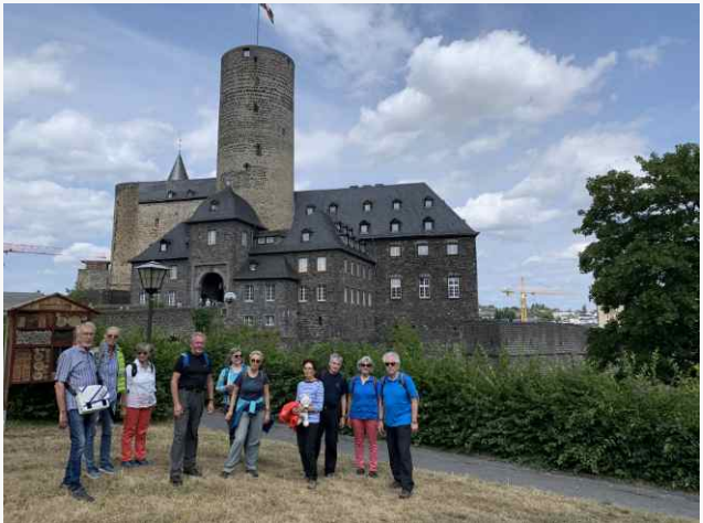
22.07.2023 An der Genovevaburg - Mayen