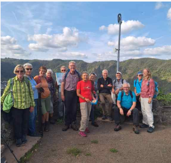
30.09.2023 Neef - Mosel