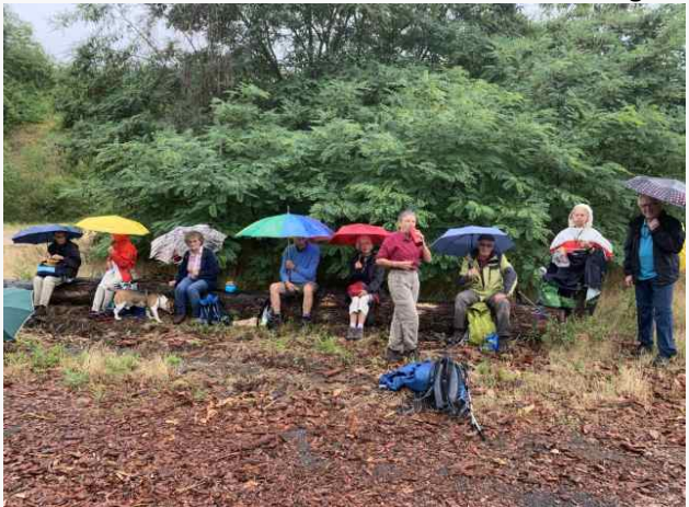
01.07.2023 Rast im Regen - Dungkopf