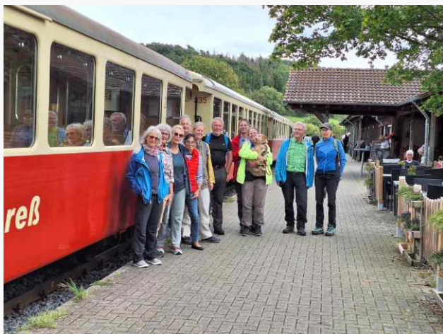
27.08.2023 Am Bahnhof Engeln - Brohltalbahn