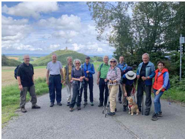
27.08.2023 Burg Olbrück - Rodder Maar