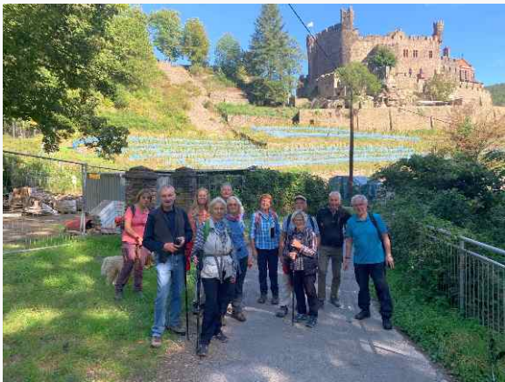
24.09.2023 Welterbestieg Mittelrhein