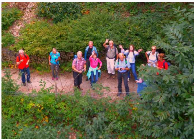
08.10.2023 Rheingau - Lift Assmannshausen