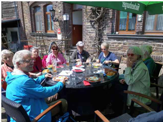
14.05.2023 Forsthof Hammerstein