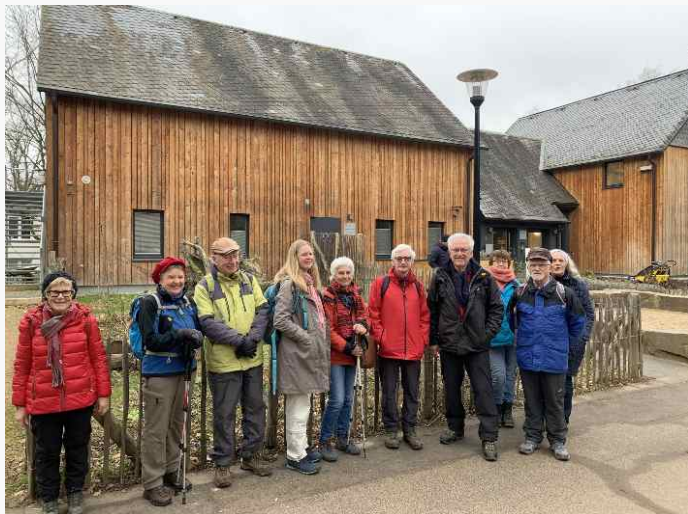
11.02.2023 Kottenforst - Haus der Natur