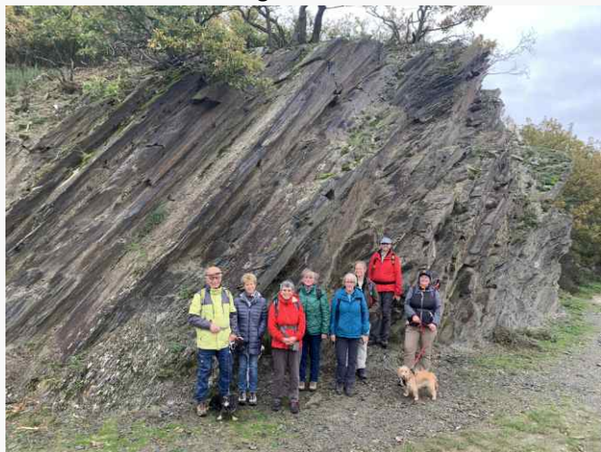
04.11.2023 Nette Romantikpfad